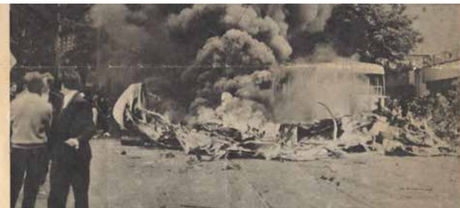
Záběr situace před pražským rozhořem 21. srpna 1968 v 10,35 min. Z budovy se ještě vyvalilo.